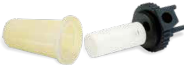
Prototype fonctionnel de filtre imprimé en plastiques rigides transparent, blanc et noir

La précision des pièces et les performances des matériaux sont parfaitement adaptées aux applications d'outillage rapide